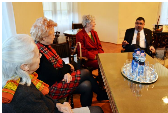
Müncheni német barátaink fogadása