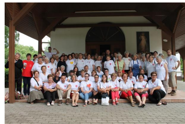
Lelkigyakorlat – Pálosszentkút