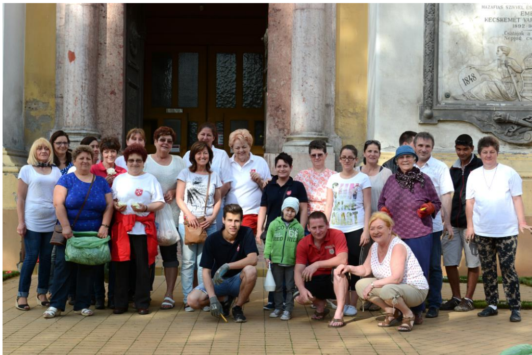
Úrnapi Virágszőnyeg készítés