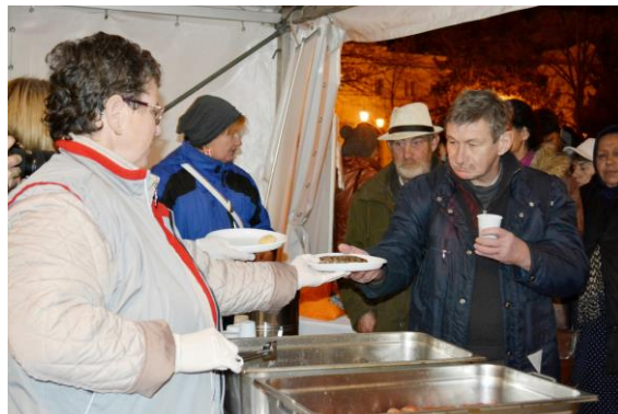
„Egy délután a hajléktalanokért”