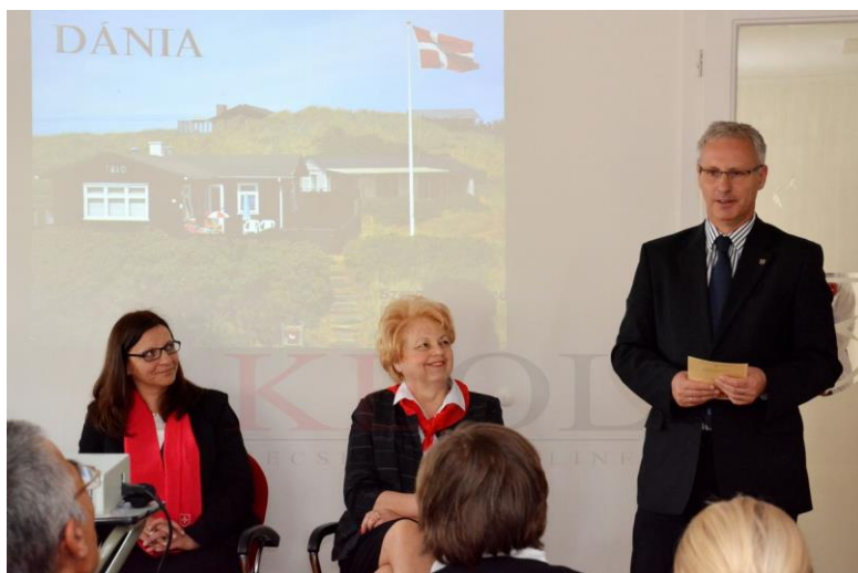
Soltész Miklós államtitkár