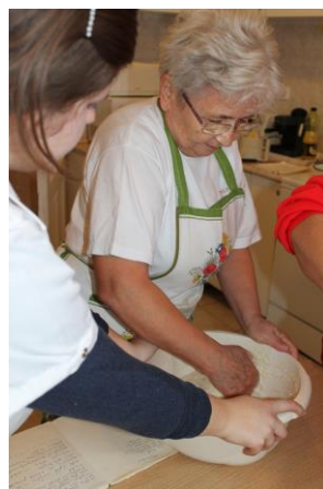
Szent Márton Napi rétes