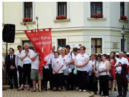
Úrnap virágszőnyeg készítés, és körmenet