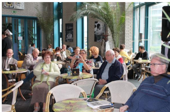
Civilvilág – Médiavilág