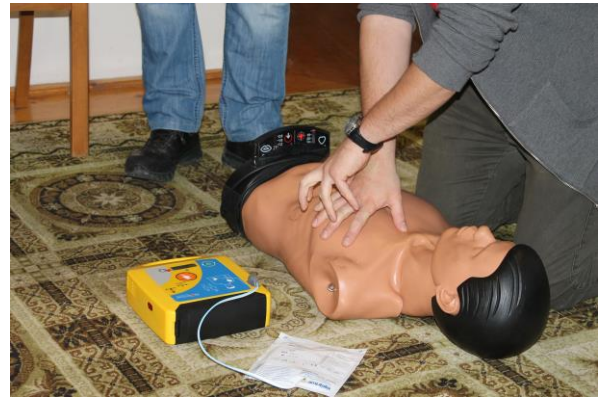
Automata defibrillátor használata képzés