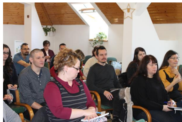
Uniós ismeretek képzés