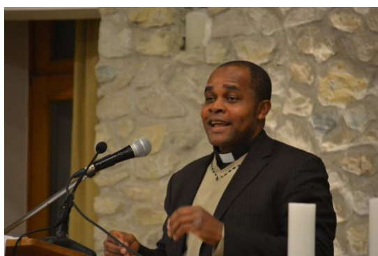
„Melegítő Szeretet” Program