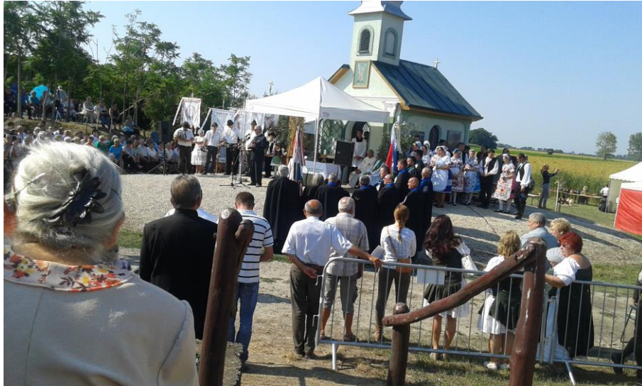
Hubertus mise Kalocsa