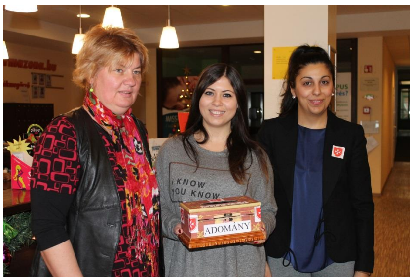
Adomány gyűjtő program a CSAO lakói számára