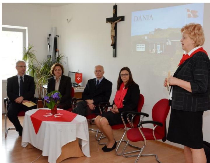
Szenereyné Pataki Klaudia polgármesterasszony