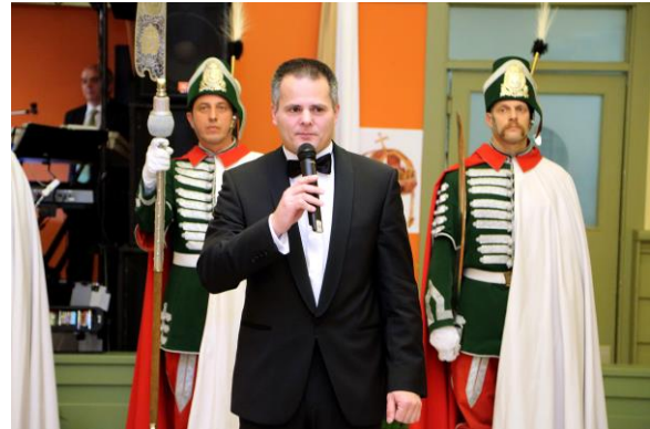
Keresztény Polgári Bál