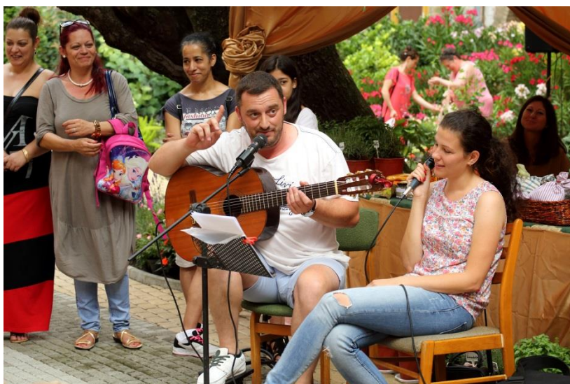
Csipkerózsikák és hercegek 2016. augusztus

A kézműves foglalkozások kreativitásukat, személyiségüket fejlesztik, a színes, különböző témájú előadásokkal ismereteik, alapműveltségük bővítik.