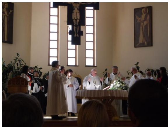
Sepsiszentgyörgy Máltai Szolgálat jubileum