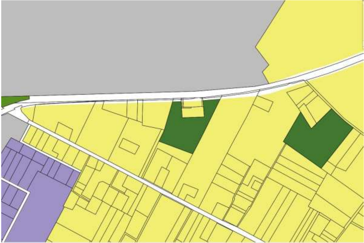
Biológiai aktivitásérték pótlás a Békéscsabai út mentén