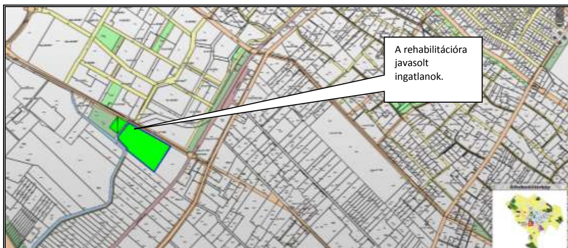
Térképmásolat a 0985/5 és a 0985/45 hrsz alatti ingatlanokról

A gazdaság élénkülésével jelentős mértékben megnövekedett a Kecskemét városban beruházni szándékozók zöldmezős beruházásra alkalmas területek iránti kereslete. Javasoljuk, hogy az egyre növekvő igények kielégítése érdekében a vagyonkezelő feladatként kapja meg az ilyen típusú területek felderítését, esetlegesen a kivásárlás és az infrastruktúra kiépítésének előkészítését.