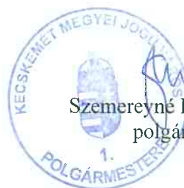
Szemereyné Pataki Klaudia polgármester