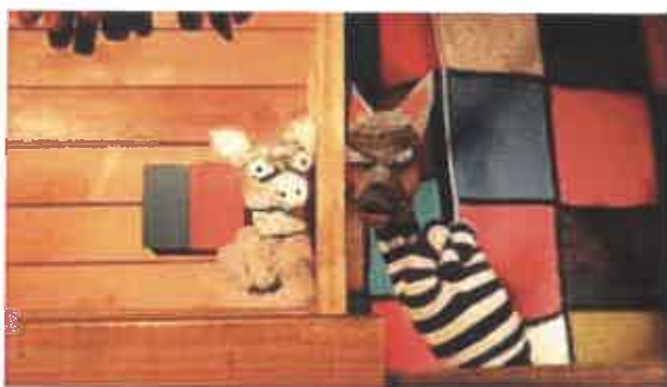
A kismalac és a farkasok

A CIRÓKArantén SZÍNHÁZ néven futó online előadások hihetetlen népszerűségnek örvendtek, a videók között jó néhány tízezren felüli nézettséget ért el. A vasárnapi előadások és a hozzá kapcsolódó Mesébelépő játék ugyancsak online formában folytatódott. Áprilisban meséíró pályázatot is hirdettünk, amelyre összesen 34 mese érkezett be. 6 meséből mesefilm készült, amelyet június 7-én, Cirókás Nap online rendezvényünkön mutattunk be. Színházunknak március közepétől június elejéig új produkcióval közel 50 megjelenése volt.