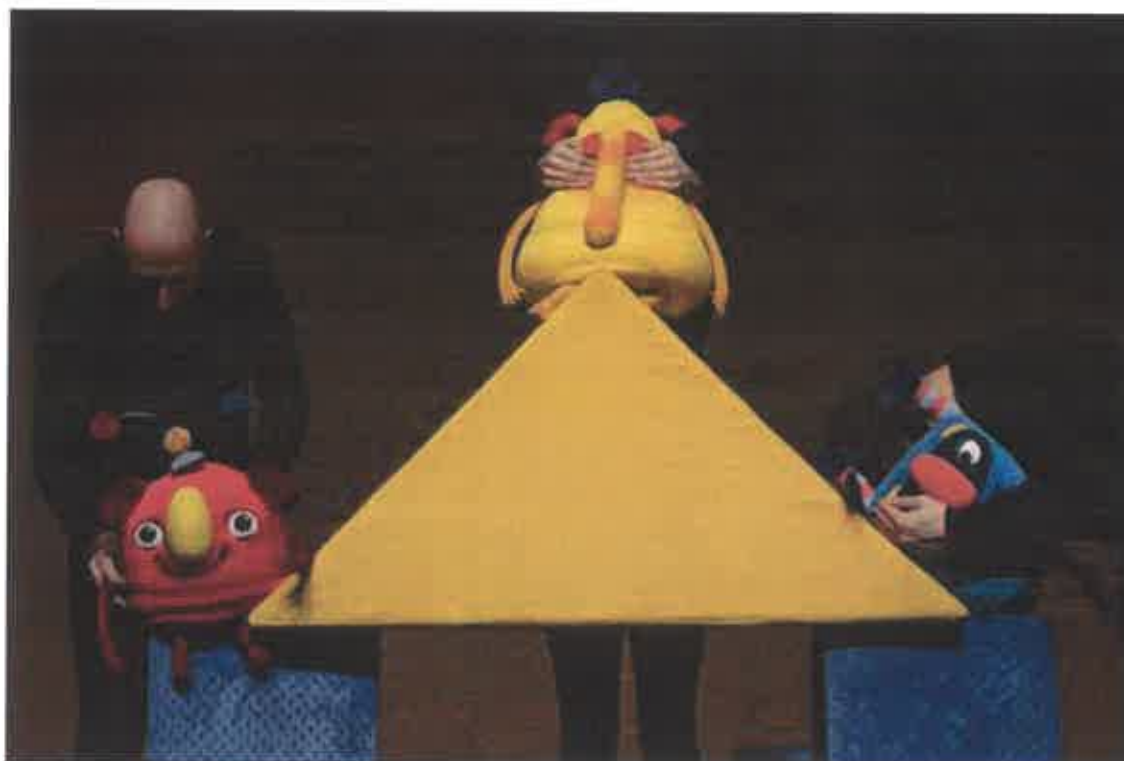
Piros, Sárga és Kék bújócskáznak.

Bábszínházunk óvodásokat megszólító, korosztályszerű előadásai között különösen kedveltek azok a produkciók, amelyet- az előadás szerves részeként- a látottakat feldolgozó, interaktív foglalkozás követ. Ilyen az Almafácska, melynek központi témája az évszakok váltakozása, vagy a Kenyérből kelt mese, amely az otthoni kenyérből készítés hagyományát eleveníti fel. Legújabb előadásunk az óvodai neveléshez kapcsolódva, most a három alapszínnel (piros, sárga, kék) és három alapvető mértani formával (gömb, téglalap alapú, egyenlő szárú, háromszög formájú mértani test és kocka) foglalkozik.