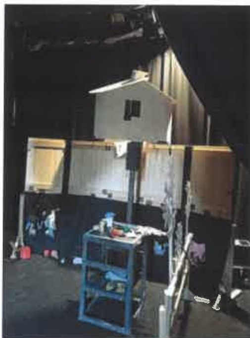
A paravános játék kulisszatitkai.

A tavaszi home office időszakban otthoni környezetben megszületett, online felületen bemutatott mini előadásainkból színházi előadás készült. A RÖF című produkció története, szereplői, mind időtlen igazságokat adnak át nekünk, mai embereknek. Mindhárom mesében előtérbe került az akció és kevesebb hangsúlyt kapott a szöveg. Az alkalmazott technika meséként változik: asztali bábjáték, paravános vásári kesztyűs játék és maszkos élőjáték. A díszlet tervezésében fontos szerepet játszott, hogy az előadás könnyen utaztatható legyen. Az előadás igazi műhelymunka eredménye, alkotói –a zeneszerző kivételével társulatunk tagjai.