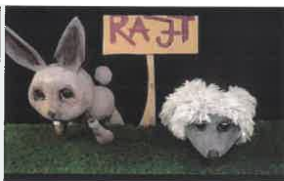
A mezei nyúl és a sündisznó