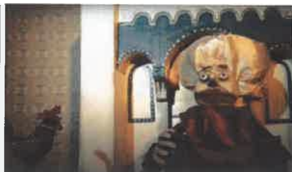
A kiskakas gyémánt félkrajcárja