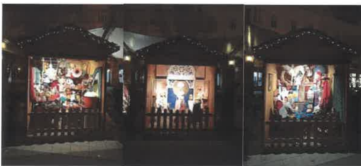
A Műhely, az Oltár és a Kuckó esti megvilágításban.

Online térbe átültetett, szabadtéren megvalósuló interaktív programunk újabb lehetőséget teremtett a nézőkkel való kapcsolattartásra. A város lakói örömmel látogatták a kihelyezett Mikuláskuckót és a betlehemi oltárt. Bábszínházunk Facebook felületén folyamatos volt a híradás, a kiállított tárgyakhoz kapcsolódóan napról-napra megújuló online játékok is várták a gyerekeket.