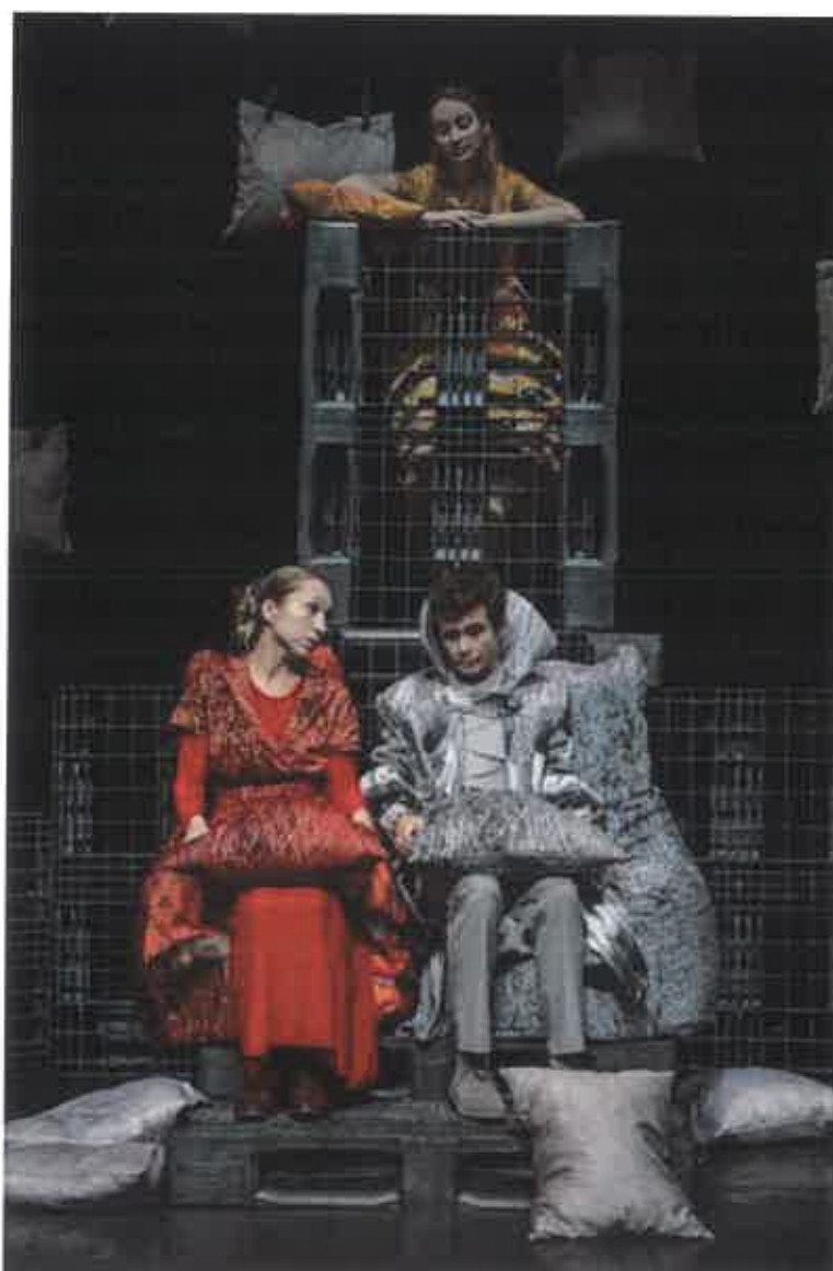
A királyné a torony 100. emeletéről is mindent pontosan lát...

Hiába azonban a varázslatos képesség, ha az ifjú hölgy híján van a türelemnek és az együttérzésnek. Ezen tulajdonságok nélkül pedig nem biztos, hogy elérhető a boldogság. A hétköznapi és a királyi között tökéletesen egyensúlyozó szöveghez alkalmazkodik az előadás tere, mely a valóságot meseivé, a mesét pedig hétköznapivá varázsolja. A bábok jól ismert tárgyakból alakulnak át, kelnek életre.