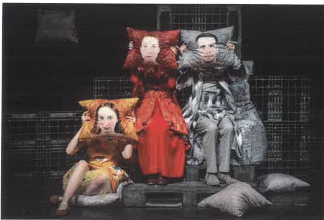
A királyi család ebben a pillanatban hivatalos arcát mutatja.

És mi a valóság? Amit a szemünkkel, vagy amit a szívünkkel látunk? Ezekre a kérdésekre keresi a választ előadásunk, kortárs színházi formák, sok zene és játék segítségével. Az örökérvényű népmese a mai gyerekek számára frissen, játékosan és átélhetően bontakozik ki a színpadon.