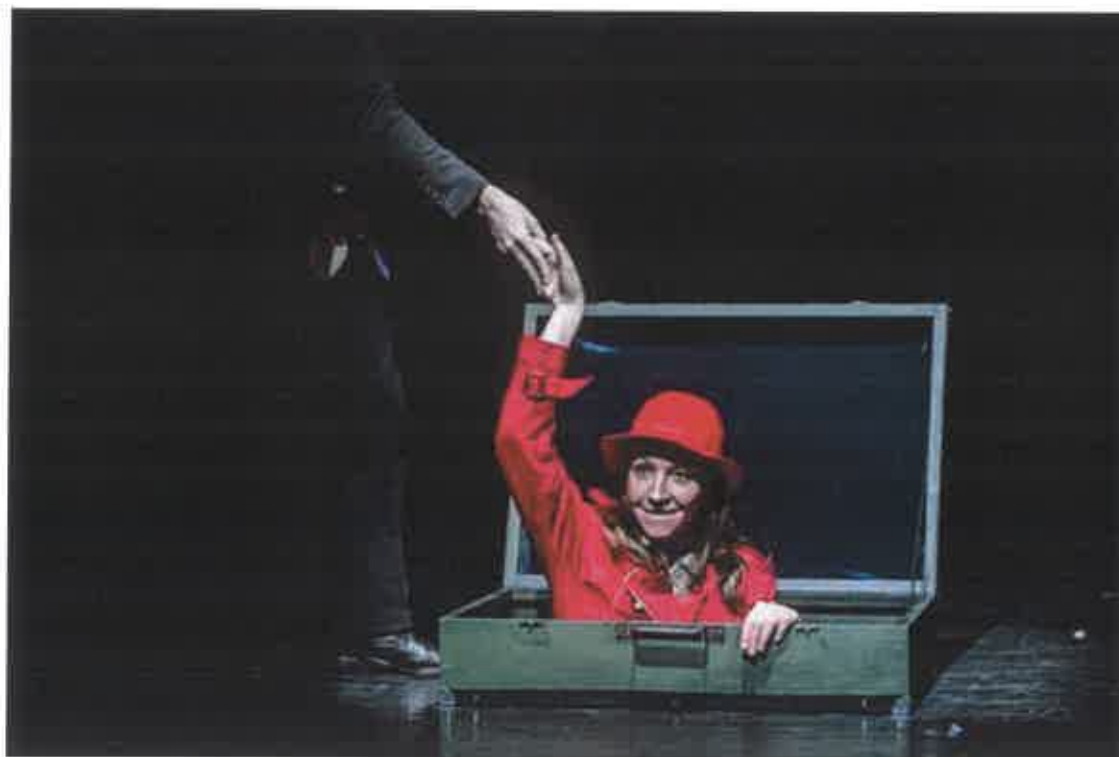
Komor úr, a magányos ember társra lel.

Komor úr a liftből kilépve már egészen másként látja a világot. És mint minden mesének, ennek a történetnek is jó a vége.