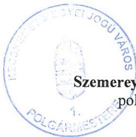
Szemereyné Pataki Klaudia polgármester