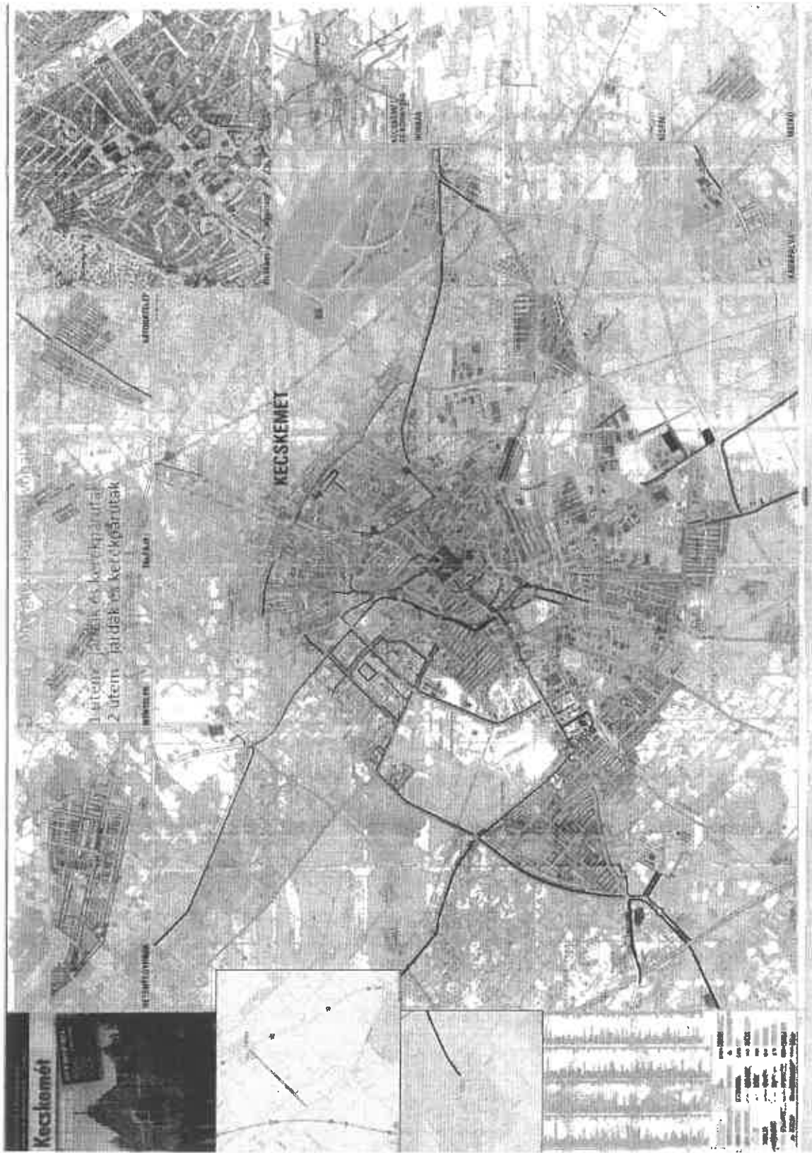
Város térkép színesrel jelölve az útszategóriákat