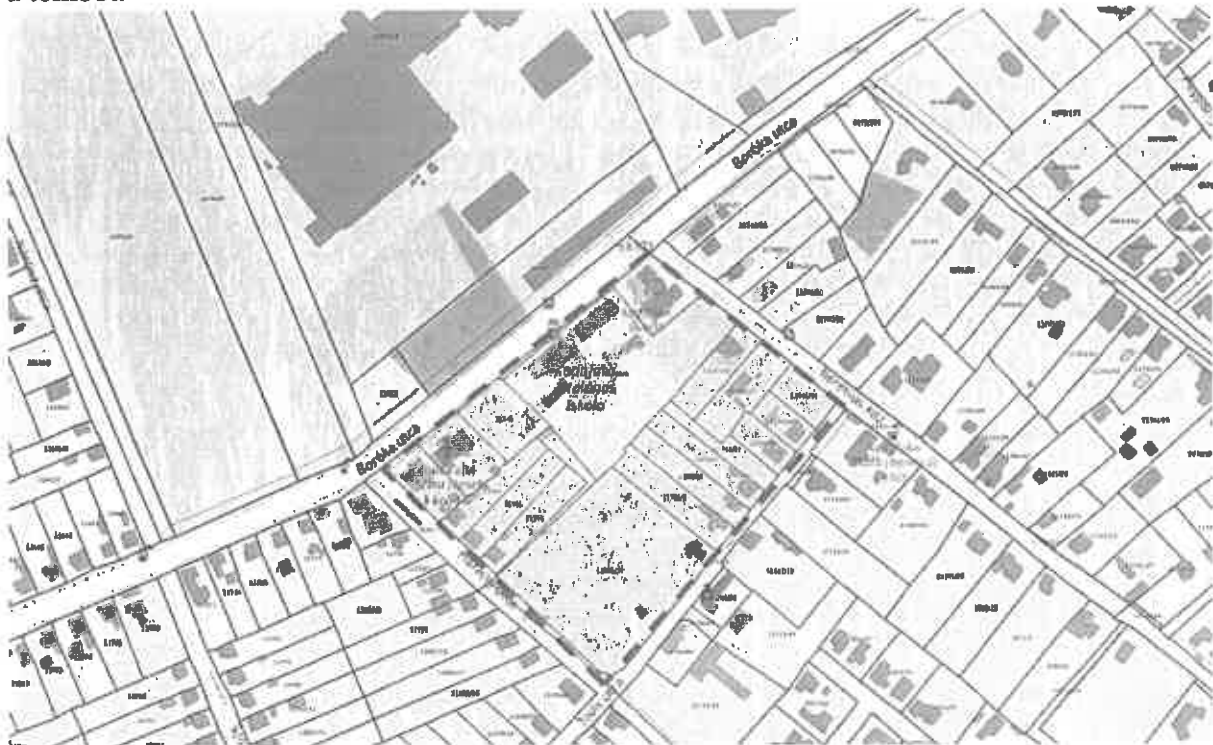
A kiemelt fejlesztési terület javasolt lehatárolása

Kecskemét, Kadafalva területén, a köznevelési intézmények fejlesztése érdekében felmerült az igény a meglévő intézményi területek bővítése telekredezéssel, a Boróka utca - Beretvás köz - Tövis utca - Harang utca által határolt tömb átalakítására, mely a hatályos Szabályozási terv módosítását igényli. A tömbön belül található a tervezett bölcsőde, a meglévő óvoda és az általános iskola, amelyek mindegyike igényli és rendelkezik is fejlesztési elképzelésekkel. Annak érdekében, hogy a tervezett telekalakítások és fejlesztések megvalósíthatók legyenek, szükséges a településrendezési eszközök módosítása, továbbá annak érdekében, hogy a fejlesztések minél előbb megvalósulhassanak, indokolt kiemelt fejlesztési területként kezelni a tömböt.