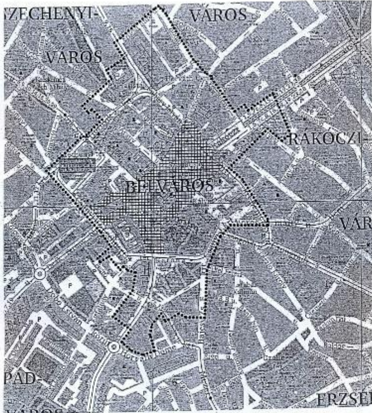
3. számú melléklet