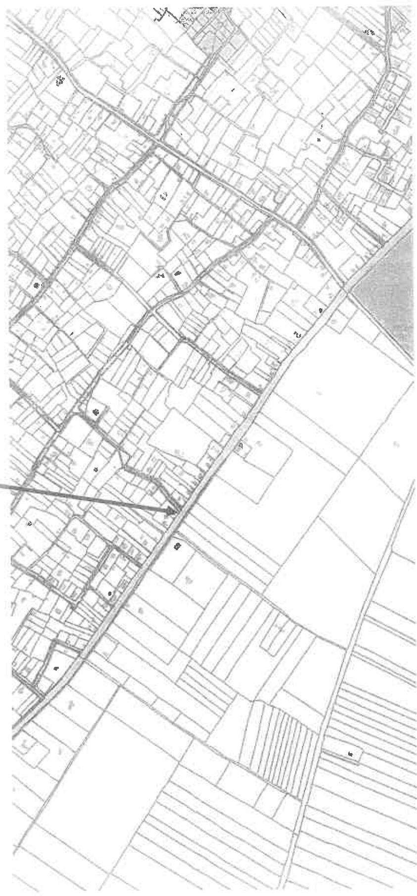
Az elnevezésre javasolt 019/2 hrsz-ú ingatlan és környezete