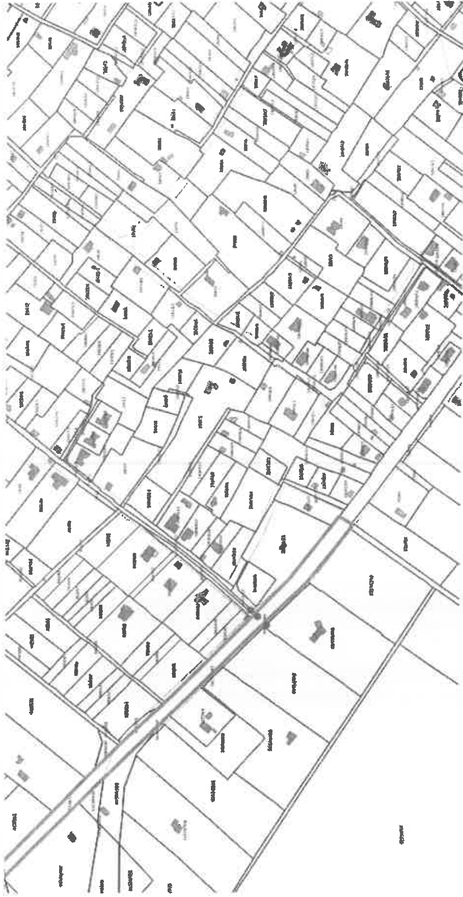
A 01538/11 hrsz-ú ingatlan vonatkozásában jövőben megvalósuló telekalaktás