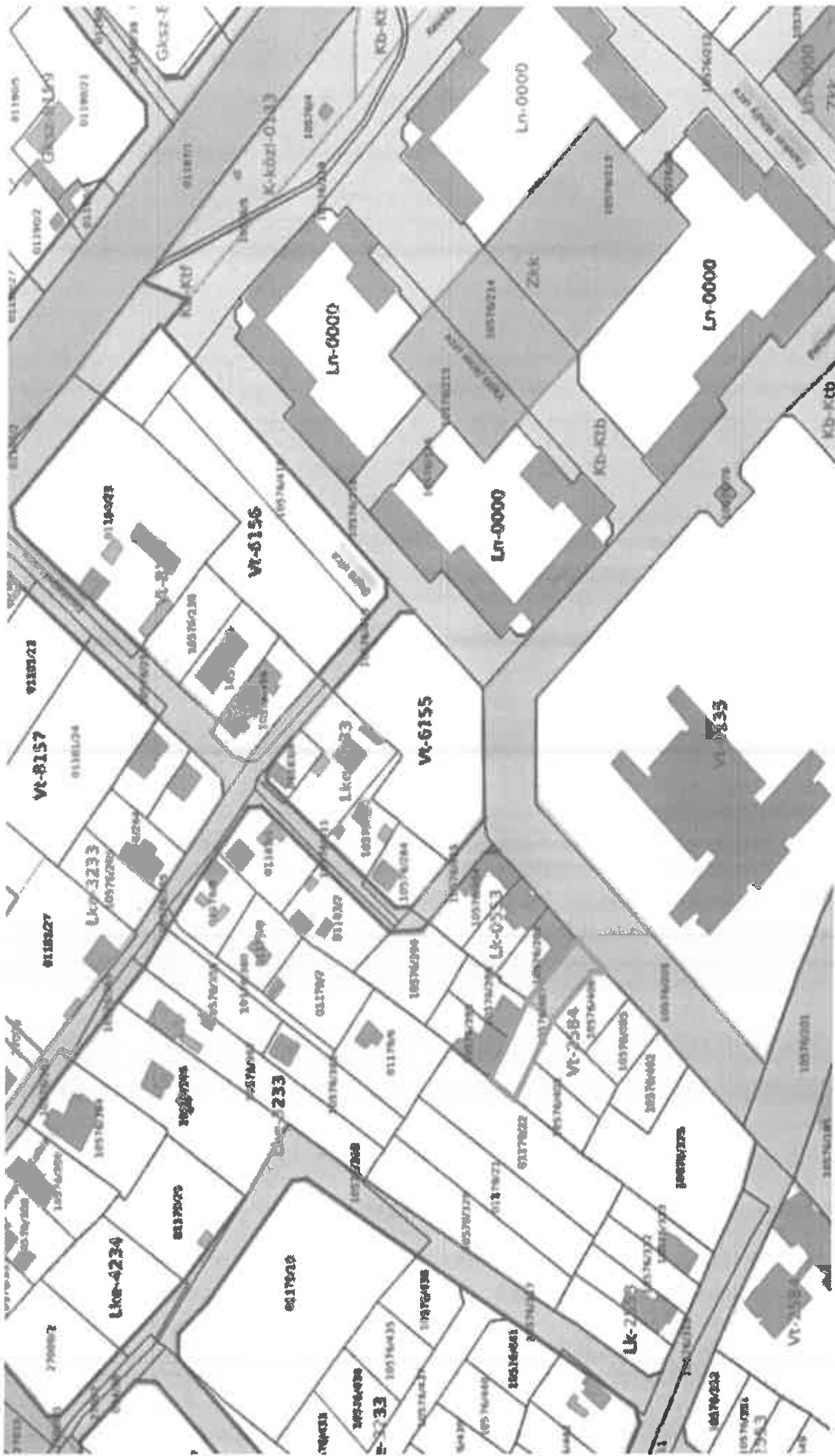
Az elnevezésre javasolt 10576/407 hrsz-ú ingatlan szűkebb környezete.