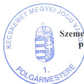
Szemereyné Pataki Klaudia polgármester