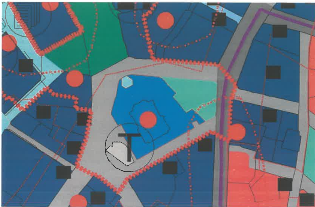
BIA egyenleg pótlása