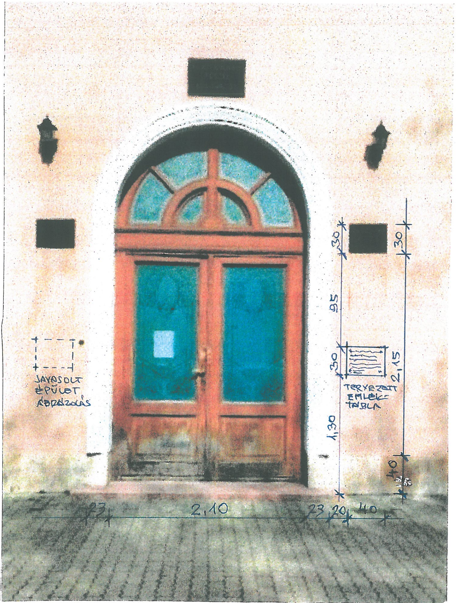
2. SZÁMÚ MELLÉKLET