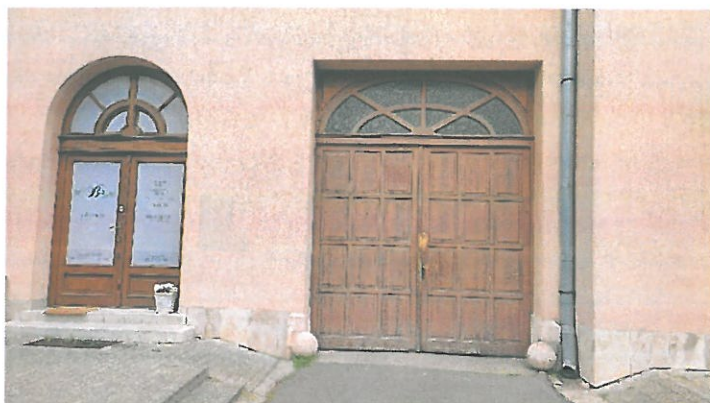
Kevésbé alkalmas falfelület

A falfelületek közül az épület személyi főbejárata mutat nyugodtabb egységesebb képet, ahol a bejárat felett és két oldalán egyszerű fekete táblák jól formált betűi nyújtanak információt arról, hogy az ajtón belépve hová lehet eljutni.