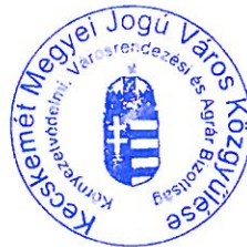
Lejer Zoltán bizottság elnöke