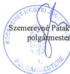
Szemereyné Pataki Klaudia polgármester