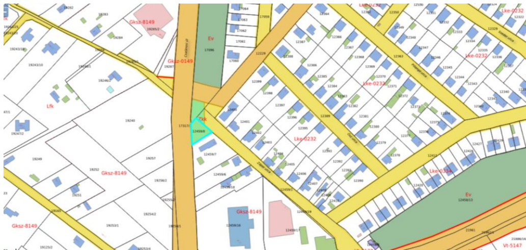
elnevezésre javasolt 10576/407 hrsz-ú ingatlan szűkebb környezete.