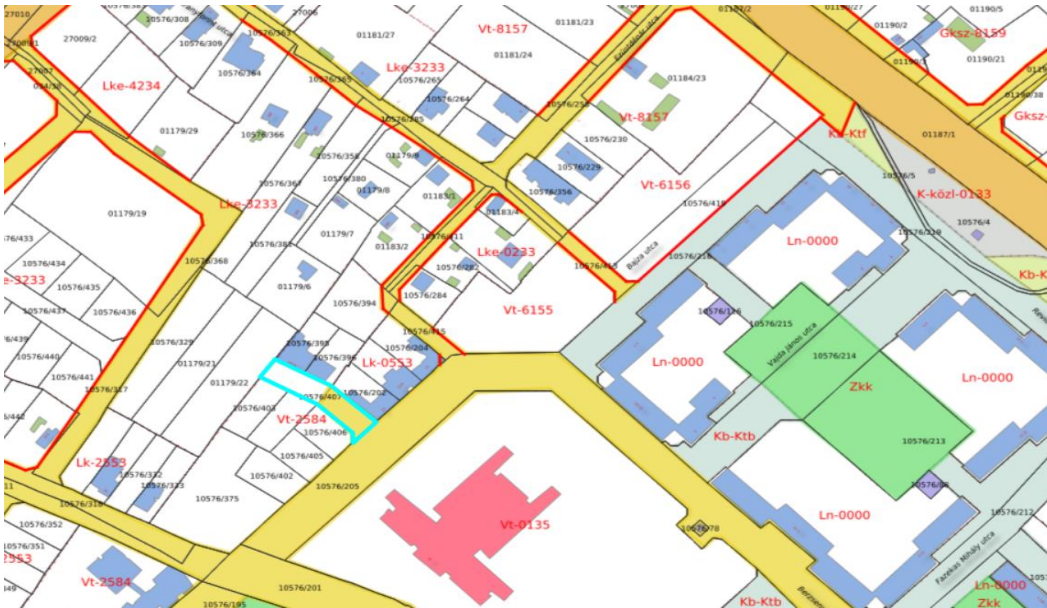
Az elnevezésre javasolt 12459/8 hrsz-ú ingatlan szűkebb környezete