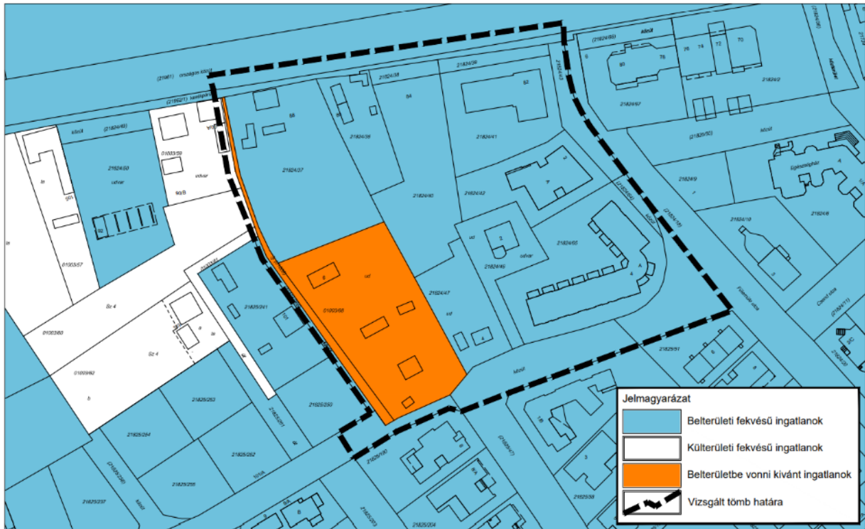
Belterületi és külterületi fekvésű ingatlanok elhelyezkedése és a rendezni kívánt ingatlanok pozíciója