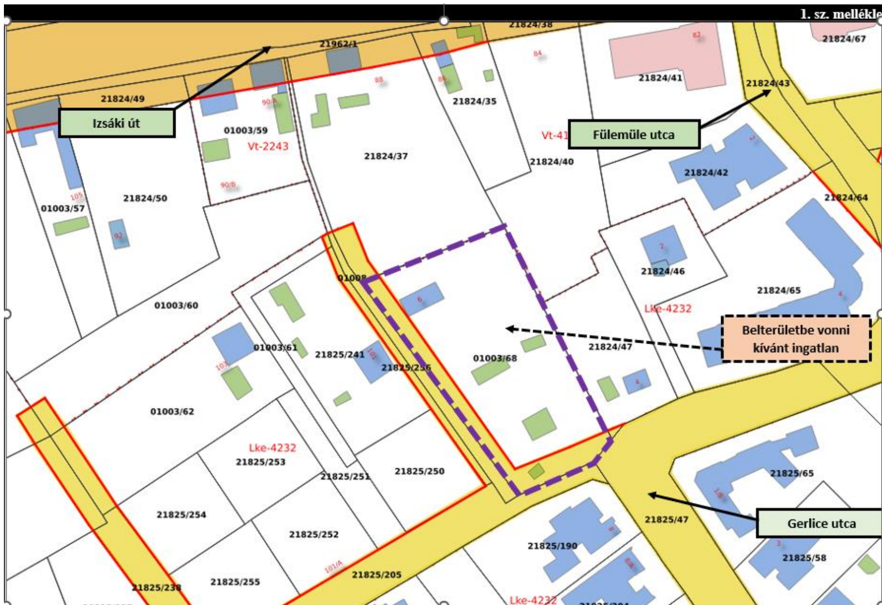
kivonat a hatályos szabályozási terv 48-11. sz. szelvényéből