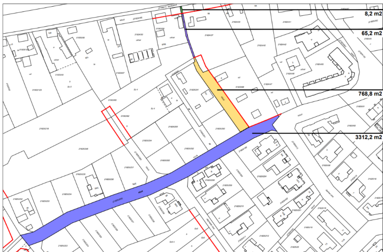
Közterületrendezési javaslat – kialakuló közterületeket a különböző színek jelölik

A telepítési tanulmányterv csak és kizárólag a telkek belterületbe vonásáról és az azt követő közterületek rendezéséről szól. A 01003/68 hrsz-ú ingatlan további felosztását tájékoztató jelleggel mutatja be a tanulmány a szabályozási előírások figyelembevételével– max. 3 db építési telek alakítható ki, de a kialakuló telek egyben is maradhat.