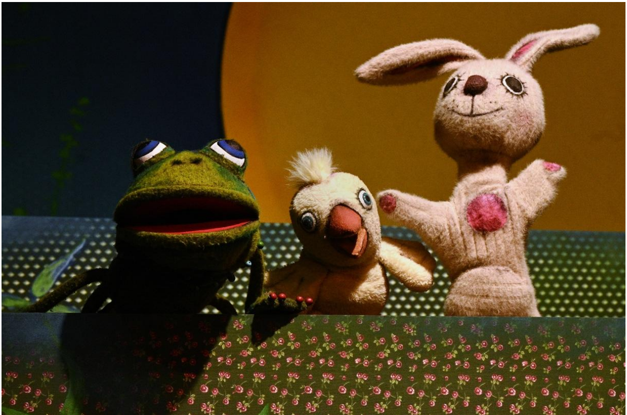
A jóbarátok: Brekus, Kispipi és Nyuszi.

A barátságról, egymás segítségéről szóló állatmesék -klasszikus paravános megvalósításban- az óvodapedagógusok kérésére került a kínálatba. Kispipi, Kiséce, Nyuszi, Brekus és Hangyácska mókás kalandokon, félreértéseken és kisebb-nagyobb vitákon keresztül tanulják meg, milyen fontos a barátság, az odafigyelés és az, hogy nem baj, ha különbözünk – sőt, így még érdekesebb az együttlét. A történet végére az is kiderül: a világ sokkal jobb hely akkor, amikor mindannyian elférünk egy nagy közös gombakalap alatt.