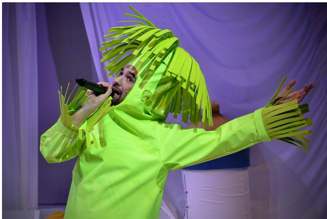
Atanáz, aki nem is olyan félelmetes.