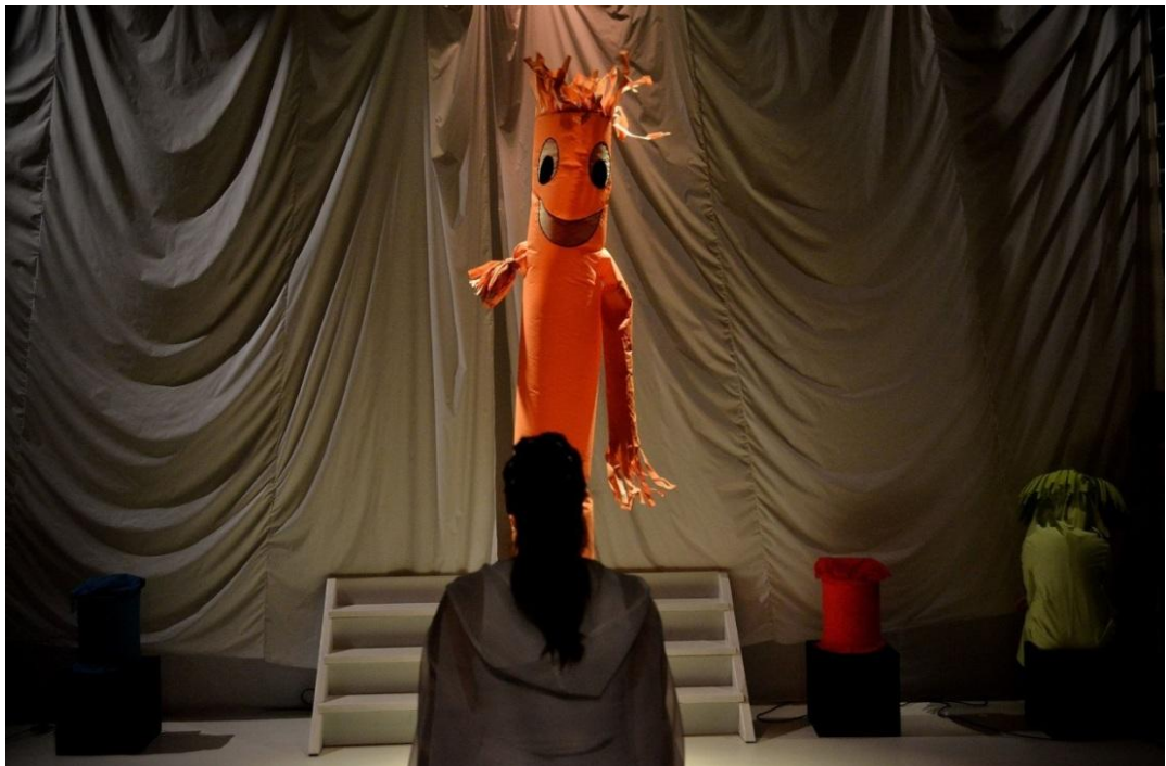
A lámpaláz legyőzhető, csak szembe kell nézni vele.

Az előadás egy jól ismert érzéssel, a lámpalázzal foglalkozik színházi keretek között. A játék során a színészek a gyerekekkel együtt vehetik szemügyre a lámpaláz jelenségét, feltérképezve a lehetséges megoldásokat.