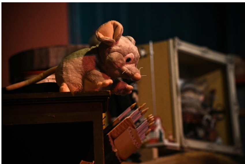
A gyerekek kedvence: Egér, a Kuckó állandó lakója.

Az interaktív előadás során az ünnepvárás titkaiba, a készülődés izgalmaiba pillanthattak be a gyerekek, miközben maguk is az események aktív résztvevőivé váltak.