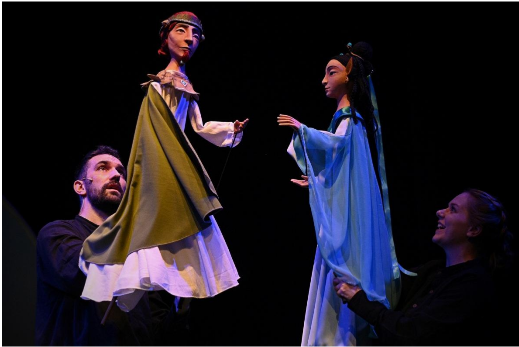
Árgyélus királyfi és Tündérszép Ilona.