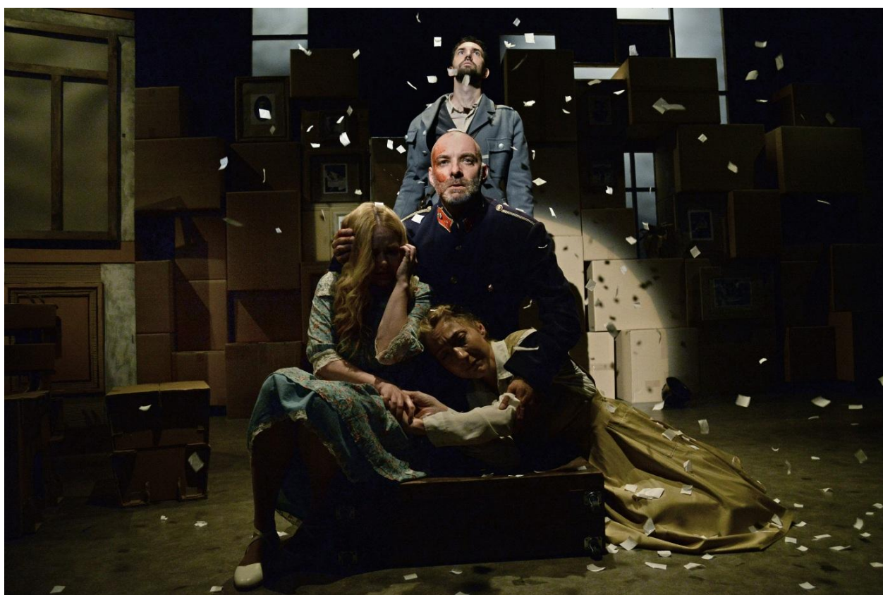
Örkény István: Tóték