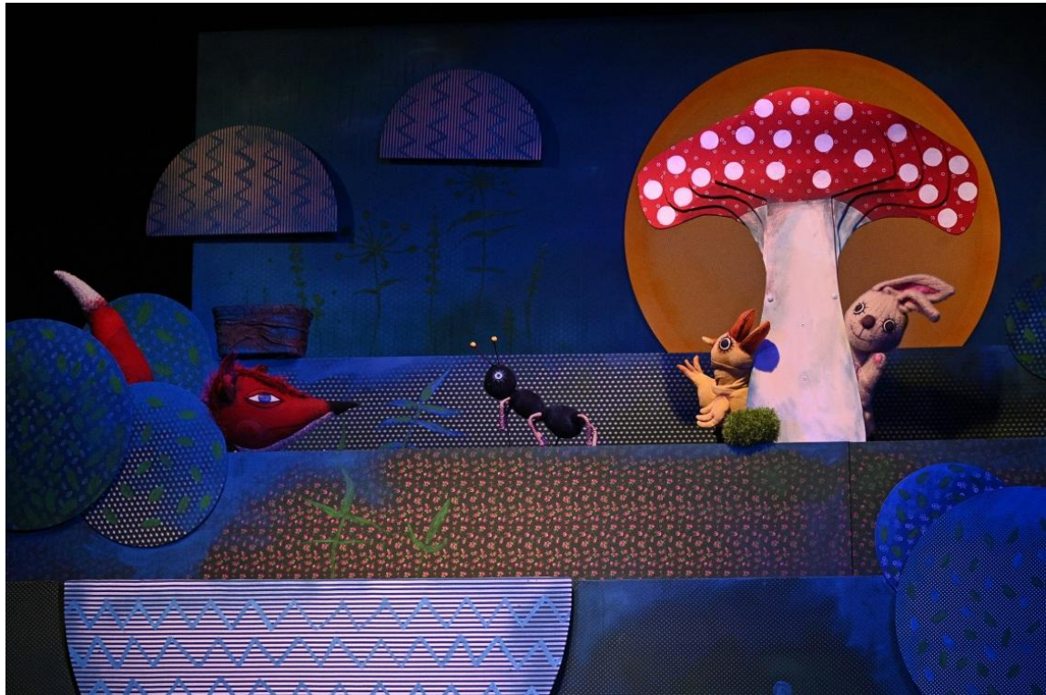
A gomba alatt.