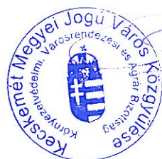
Lejer Zoltán bizottság elnöke