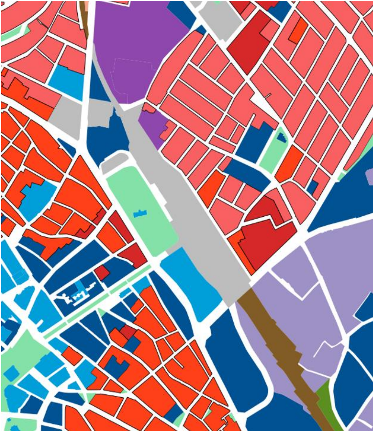
Intermodális csomópont és környezete