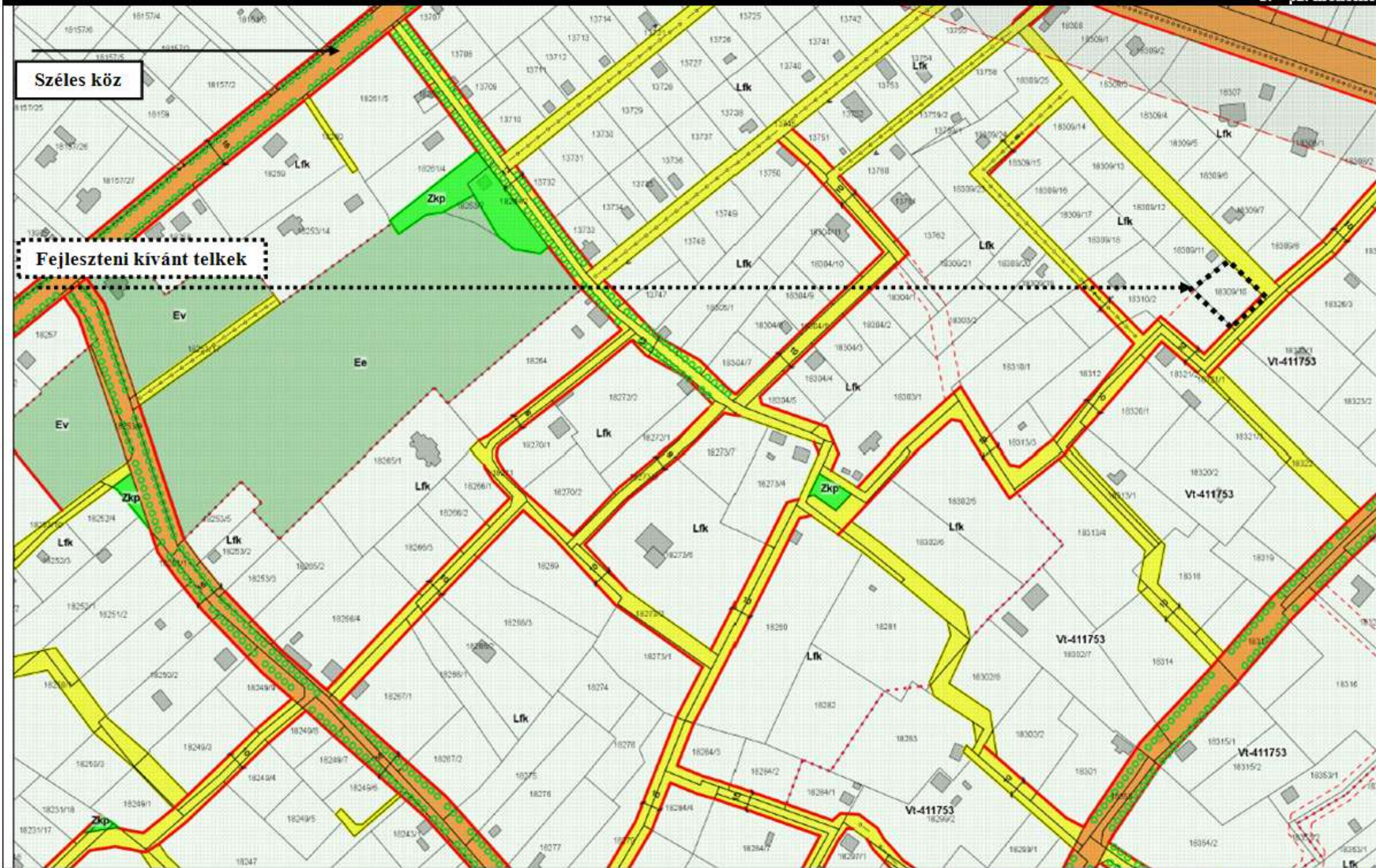
Kivonat a hatályos szabályozási terv 38-42. sz. szelvényéből