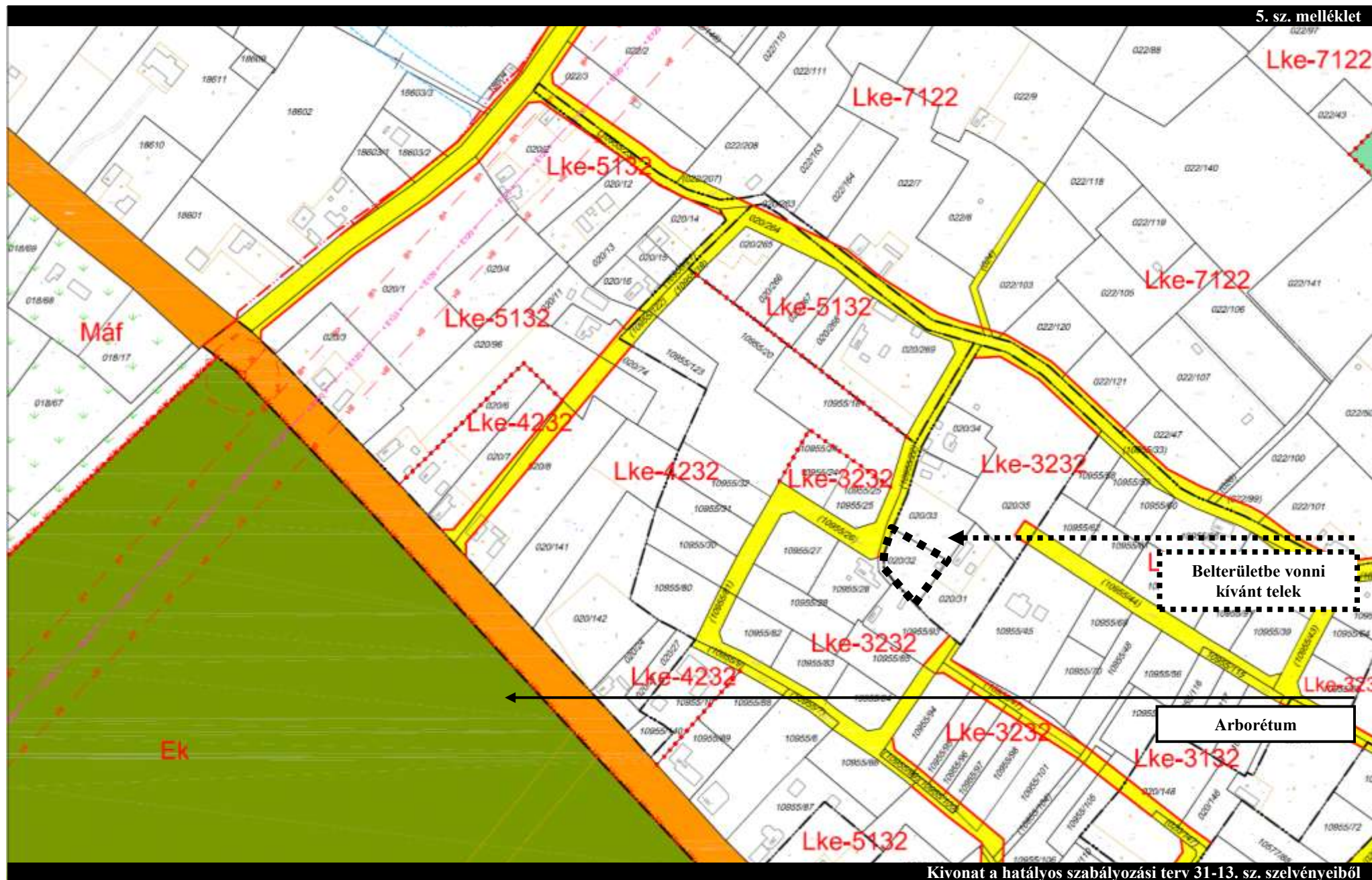
Kivonat a hatályos szabályozási terv 31-13. sz. szelvényeiből