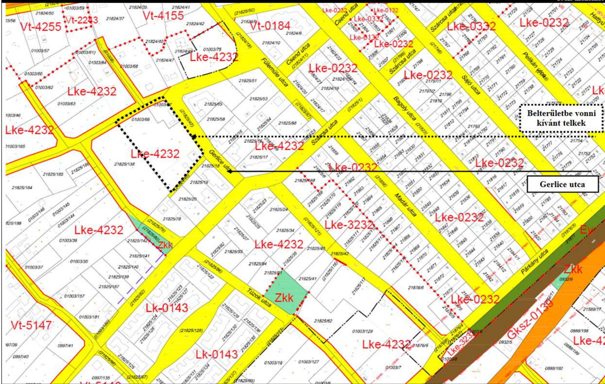
Kivonat a hatályos szabályozási terv 48-II. sz. szelvényéből