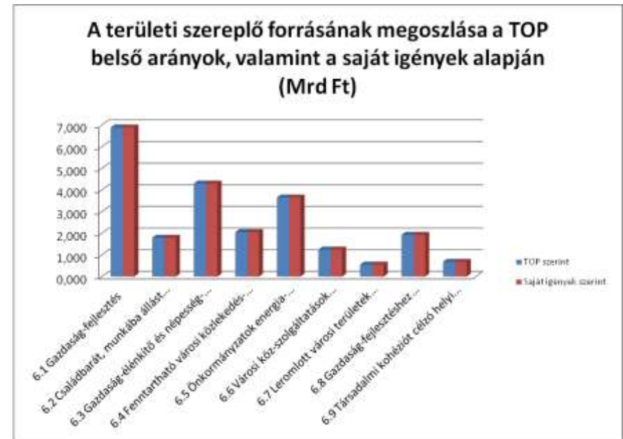
1. diagram: Kecskemét ITP TOP intézkedésenkénti forrásaránya