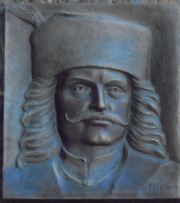
II. RÁKÓCZI FERENC 1676 — 1735