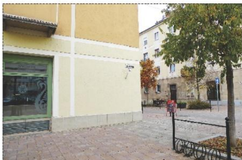
MEGLÉVŐ RÁKÓCZI ÚTI HOMLOKZAT