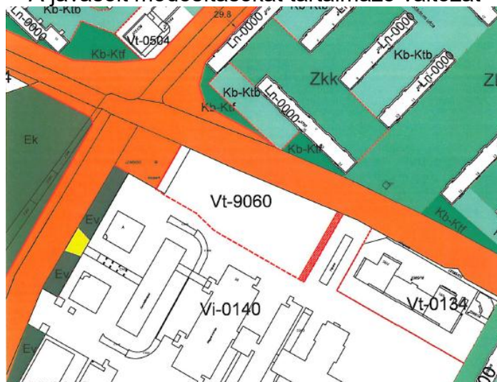
A javasolt módosításokat tartalmazó változat