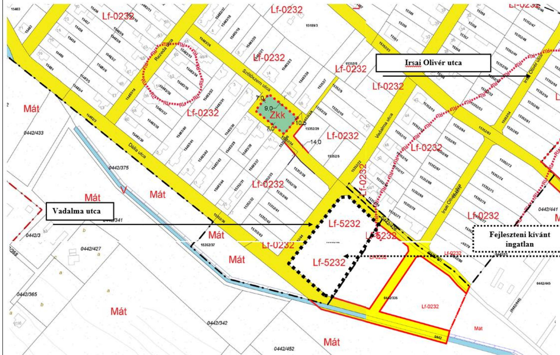
Kivonat a hatályos szabályozási terv 17-24., 17-42 és 18-13., és 18-31. sz. szelvényeiből