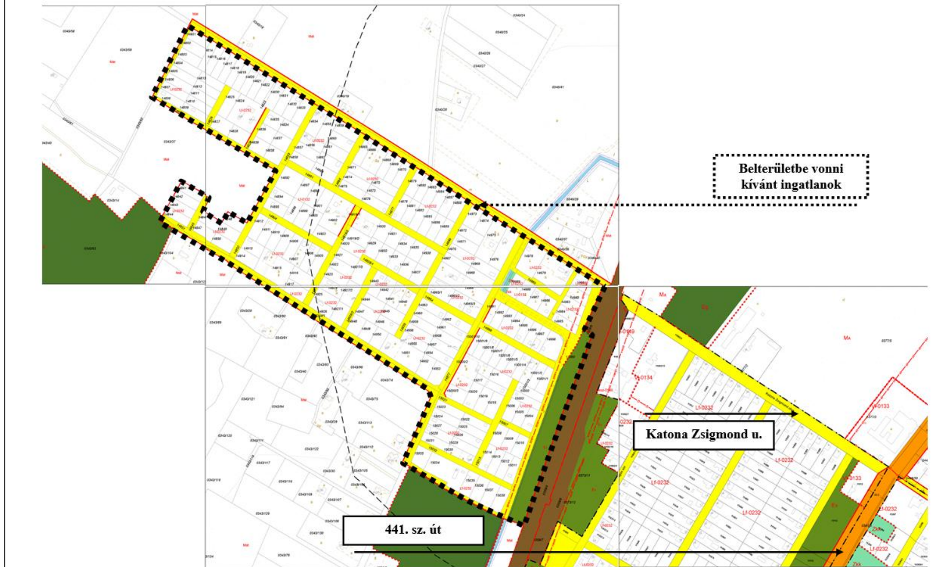
Kivonat a hatályos szabályozási terv 10-32., 10-41., 10-43., 10-44., sz. szelvényéből