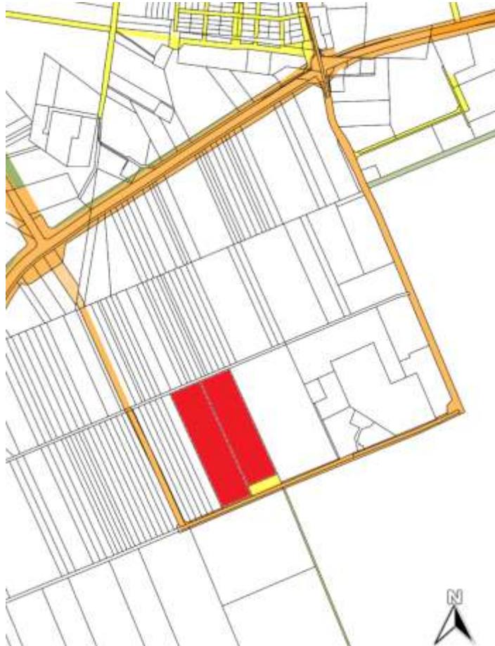
a tervezett fejlesztés helyszíne

A településrendezési szerződés megvalósulása érdekében a településrendezési kötelezettség tényét az ingatlan-nyilvántartásba az önkormányzat bejegyezteti a Kecskemét Járási Hivatalnál. Az érintett telkek belterületbe vonásához a belterületi kapcsolat biztosításához szükséges az önkormányzati tulajdonú, 0801/323, 0809/308 és a 0809/339 hrsz-ú utak belterületbe vonása is.