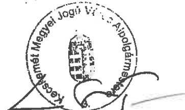
dr. Szeberényi Gyula Tamás alpolgármester